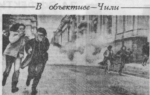
В объективе — Чили