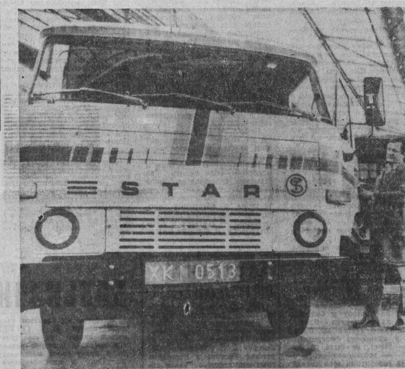
ПОЛША. Грузовая машина «Стар-742» — одна из пяти новых моделей машин, созданных на автозаводе имени Ф. Дзержинского в городе Старогаров. Выполнение социалистических обязательств, взятых трудовым коллективом в честь предстоящего X форума коммунистов, — свидетельство решительной поддержки трудящимися линии партии, направленной на дальнейшее укрепление социалистического завоевания, повышение благосостояния народа.

ЛОНДОН. Расистские власти ЮАР препятствуют выезду в страну видного политического деятеля Великобритании, министра иностранных дел в «теневом кабинете» лейбористской партии Денниса Хилли и парламентария — лейбориста Дональда Андерсона, которые приглашены советом церкви. Как отмечает агентство Пресс Ассошиэيشн, такая позиция южноафриканских властей вызвана тем, что эти британские парламентарии неоднократно добивались введения эффективных экономических санкций против расистского режима. (ТАСС).