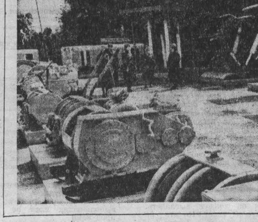
Накануне юбилея города и завода «Киселевский машиностроительный завод» имени Ивана Черных...

Побывав у машиностроителей, во многих цехах заменив старое оборудование на современное. Построен новый цех по производству станков.