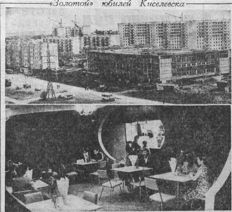
(Продолжение. Начало на 1 и 2-й стр.)

Конечно, работ по благоустройству города и сегодня, как говорится, непочатый край. Но вот что замечено не только мной: кто не был года три в нашем городе, сразу отмечает перемены. Светлее, чище, моложе становится город. И зеленее.