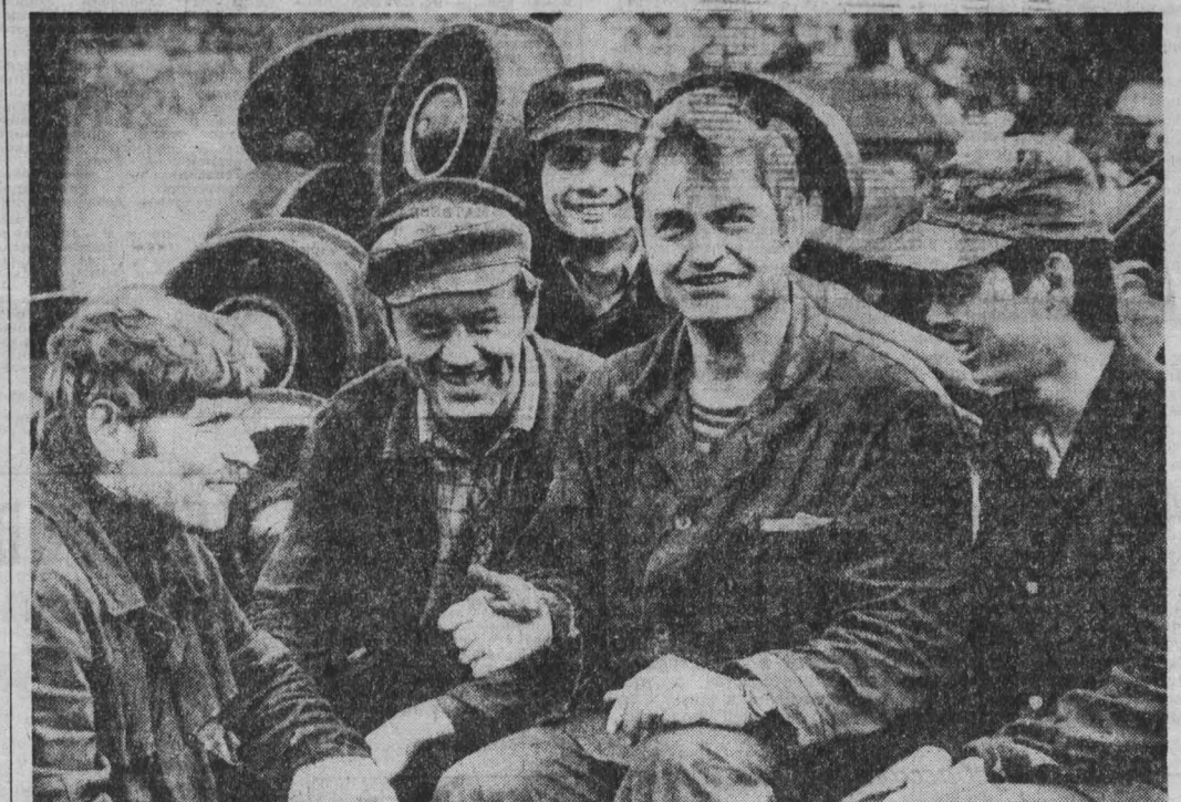
Накануне юбилея города и завода «Киселевский машиностроительный завод» имени Ивана Черных...