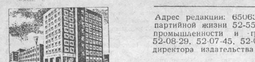
Адрес редакции: 650630 ГСП, Кемерово, проспект Октябрьский, 28. Телефоны: приемной редактора 52-32-74, заместителя редактора 52-36-45, 52-52-66, ответственного секретари 52-33-59, отделов: партийной жизни 52-55-47, 52-66-22, пропаганды 52-53-23, 52-64-88, Советов народных депутатов 52-62-33, 52-63-22, культуры 52-54-23, 52-65-47, угольной промышленности 52-35-66, 52-51-23, 52-42-01, и транспорта 52-39-34, 52-50-45, 52-44-23 сельского хозяйства 52-37-33, 52-49-78, строительного 52-34-23, 52-46-22, 52-45-29, 52-57-67, писем и абонентов 52-05-22, 52-06-01, 52-08-29, 52-07-45, 52-03-22, информации и спорта 52-47-45, 52-48-65, еженедельника «Панорама» 52-18-78, прием информации 52-34-56, иллюстрации 52-14-12, 52-25-23, общественной приемной 52-02-10, директора издательства 52-79-10, объявлений 52-69-33, бухгалтерии 52-70-10. Собственные корреспонденты в Маринске 2-31-20, Новокузнецке 47-02-04, Осиинниках 2-35-64, Ленинске-Кузнецком 2-68-97. 1 2 3 4 5 6 8

ДЕЛИ. Мы приветствуем решение Советского Союза продлить односторонний мораторий на ядерные испытания до 8 августа. Этот шаг свидетельствует о крайне ответственной позиции, которую занимает Советский Союз в вопросе ядерного разоружения. Об этом заявил премьер-министр Индии, председатель делегации на переговорах Раджив Ганди, выступая в Делиском аэропорту после возвращения из поездки по ряду африканских государств. (ТАСС).