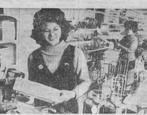
КНРД. Решению задачи более полного удовлетворения спроса населения на товары народного потребления способствует созданная в КНРД разветвленная сеть фирменных магазинов, предлагающих покупателям широкий выбор продукции легкой и пищевой промышленности. Только в 1985 году в городах и селах республик открылось более 200 таких специализированных торговых точек. НА СНИМКЕ: в одном из магазинов бытовых приборов в Пенянье.

тону, который своими интервенционистскими действиями в Центральной Америке, как считают США, сказался на расхождении позиций в переговорах по мирному урегулированию конфликта в Центральной Америке, заявил журналистам глава делегации Никарагуа, заместитель министра иностранных дел республики Виктор Уго Тинико. Эти действия США, сказал он, расходятся со словами американских государственных и политических деятелей, которые заявляют о «поддержке» Контадорской группы. Предложение Никарагуа, подчеркнул он, открывает реальные пути для переговоров по наиболее важным вопросам региональной безопасности. Участники совещания решили продолжить обсуждение вопросов, связанных с установлением мира в Центральной Америке, на очередной встрече. Ее намечено провести 27 мая в панамской столице.