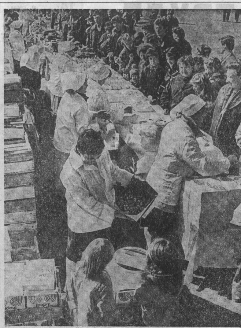
На площади старого цирка прошла выставка-продажа полуфабрикатов, кулинарных и кондитерских изделий, которую организовал трест ресторанов областного центра. Здесь приняло участие восемь предприятий города. Сотни посетителей смогли увидеть и купить продукцию кондитера, кулинаров. Опытные мастера щедро делились секретами приготовления блюд. В этот день было продано различной продукции более чем на 12 тысяч рублей. Подробные выставки работники треста решили сделать традиционными.

В. МАТВЕНКО, заместитель председателя областного комитета Общества Красного Креста.