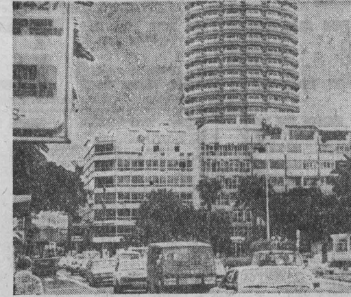
Город Лас-Пальмас — центр одноименной испанской провинции, главный город Канарских островов. Расположенный на перекрестке океанских и морских путей, стал важным транспортным узлом в Атлантике. Работа в порту, а также курортное обслуживание туристов — вот основные сферы занятости местного населения.