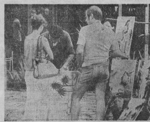
НА СИМНАХ: местный художник предлагает свои произведения туристам.