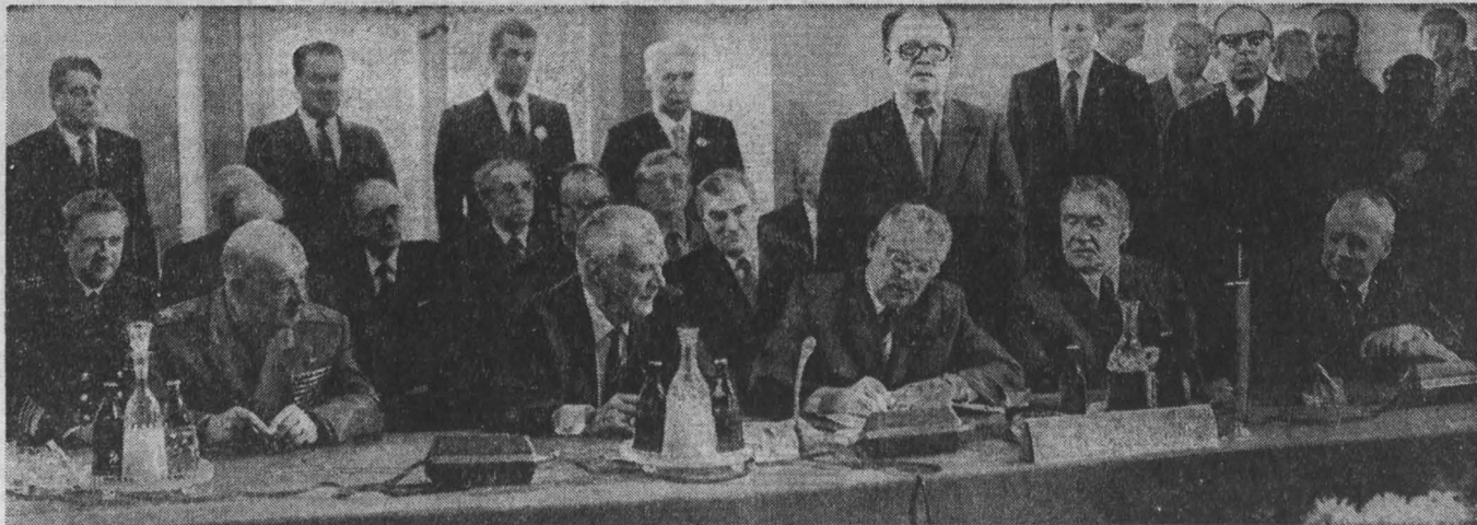
На снимке: глава советской делегации Генеральный секретарь ЦК КПСС М. С. Горбачев подписывает «Протокол о продлении срока действия Договора о дружбе, сотрудничестве и взаимной помощи».

Генеральный секретарь РКП, Президент СРР; за Союз Советских Социалистических Республик — М. С. Горбачев, Генеральный секретарь ЦК КПСС; за Чехословацкую Социалистическую Республику — Г. Гусак, Генеральный секретарь ЦК КПЧ, Президент ЧССР.