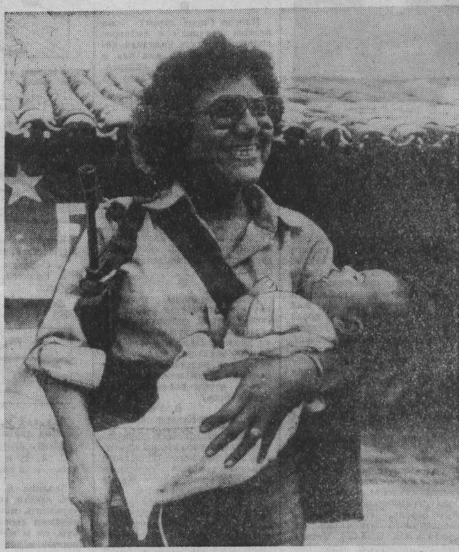
ПАРТИЗАНСКОЕ движение в Сальвадоре пользуется все возрастающей народной поддержкой.

КАБУЛ, 26 апреля. (ТАСС). Здесь завершила работу Лоя джирга — высший совет Демократической Республики Афганистан.