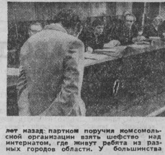
В совете самые уважаемые и авторитетные люди — ветераны труда, коммунисты. Трудные беседы идут на заседаниях совета, когда взрослому человеку приходится доказывать простые истины, заставляя его поверить в себя.