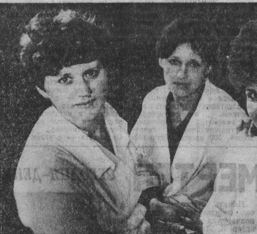
НА СНИМКЕ вы видите электрослесарей КИИП Топкинского цементного завода.