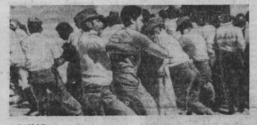
В ЮАР не стихают массовые выступления против преступной системы апартеида. В Кейптауне специальные силы по борьбе с беспорядками, брошенные главными государствами апартеида на разгром мирной демонстрации, жестоко расправились с безоружными людьми. НА СНИМКЕ: во время ареста демонстрантов в Кейптауне.