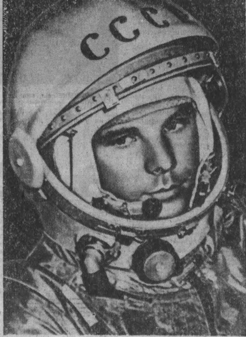
Юрий Алексеевич Гагарин перед полетом в космос. 1961 год.