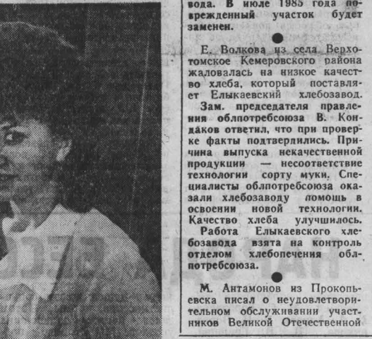
четкая и бесперебойная работа сложной аппаратуры, а в конечном итоге — всего оборудования на предприятии.