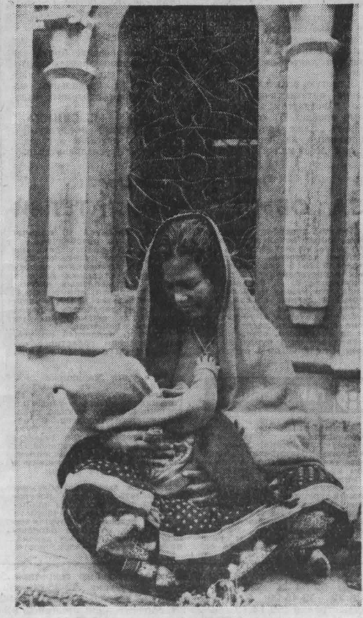
В объективе — Непал. НА СНИМКЕ: материнство. (ТАСС).

БАГДАД, 11. (ТАСС). Правительство Иракской Республики объявило персоной нон-грата и выслало из страны временного поверенного ФРГ в Ираке Х. Арндта. Ему предъявлено обвинение во «вмешательстве во внутренние дела Ирака».