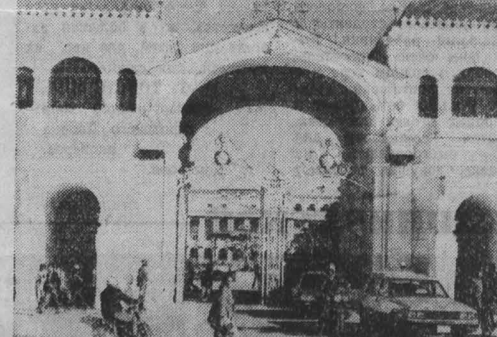
В объективе — Непал

«Страна, унывающая в горах» — так еще недавно можно было слышать о Непале. И действительно, географическая обособленность королевства помогла ему сохранить свою самобытность, уберечь вековые национальные традиции и обычаи от внешнего влияния. Однако сегодня говорить об изоляции страны, раскинувшейся на 140 тысячах квадратных километров, было бы неверно. Непал уверенно вышел на международную арену и играет немаловажную роль в наладке участника движения нерасчленения. Он выступает за укрепление мира и добрососедства в Азии. Более шестидесяти миллионов непальцев упорно трудятся над решением сложных социально-экономических проблем, стоящих перед страной.