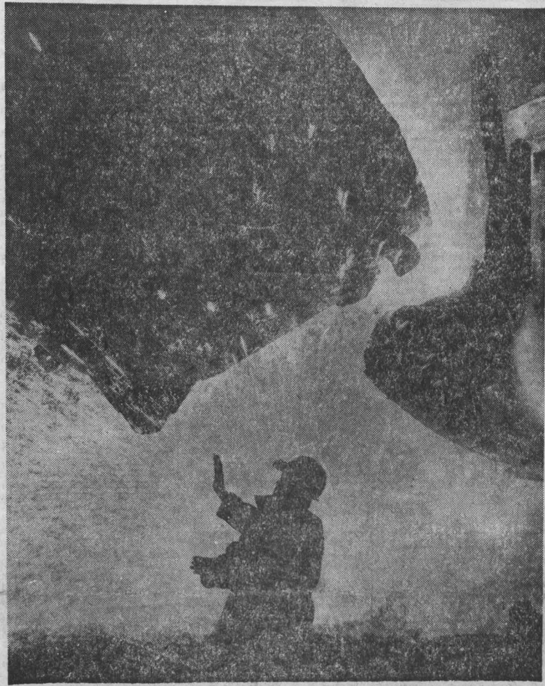
НА СНИМКЕ: идет сталь Запсиба.

К сожалению, коренным образом не сможем поправить дело с воспроизводством стада — по сравнению с предыдущим годом на сто коров мы недополучили по три теленка, а отсюда, конечно, и снижение продуктивности. В прочие проблемы. Сейчас работаем над тем, чтобы выравнять этот показатель. Стабилизировалось положение с сохранностью стада, но главное, считаем, сумели добиться поворота в сознании людей. Труженики наши стали работать ответственно. Организационное и партийное укрепление животноводческого звена, которое мы предприняли, решение вопросов со снабжением топливом, горюче-смазочными материалами, принятые меры в устранении последствий холодной волны привели к тому, что предстоящие трудности не пугают животноводов — они готовы к ним. Записал Б. СИНЬСКИЙ. Яшкский район.