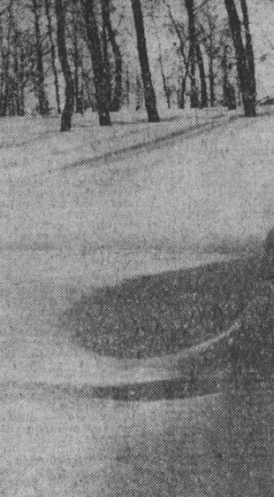
Солнце на лето...