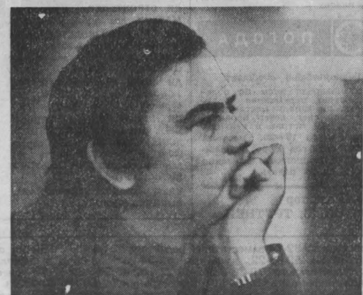
Писатель Валентин Распутин.

На повторных гастролях в Москве, состоявшихся в 1978 году, сразу три спектакля служили «визитной карточкой» афиши иркутского театра. Комедия А. Вампило-