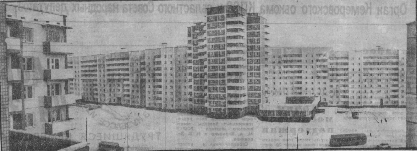
Проспект Мира — самая красивая улица Усть-Илимска.