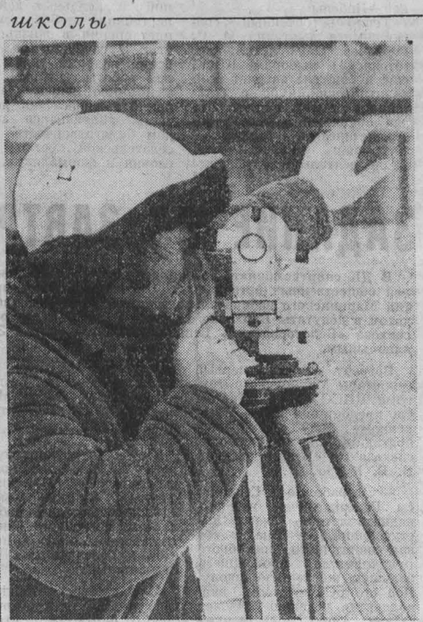
Стройки особой важности: школы