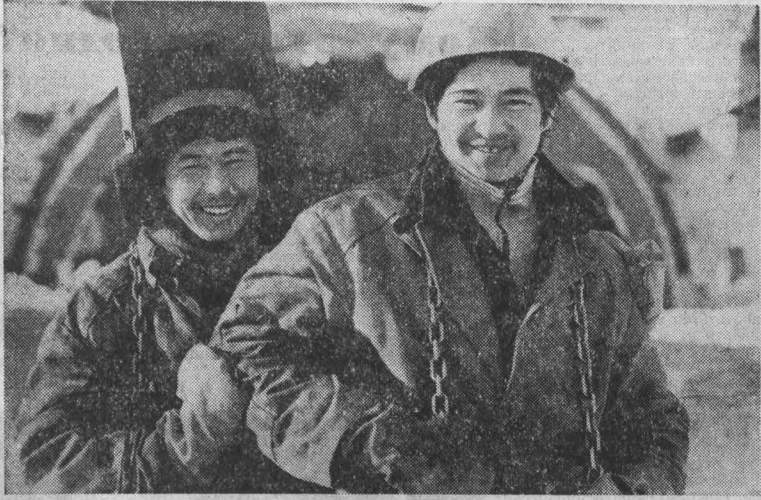
В ТАШТАГОЛЕ проходчики ШСУ-1 треста «Таштаголашахтострой» ведут проходку самого глубокого в Сибири ствола. «Сибиряк», так назван этот ствол, опустится вглубь более чем на тысячу метров. Шахтостроители уже смонтировали металлическую опалубку, проходческий полук, португальскую машину.