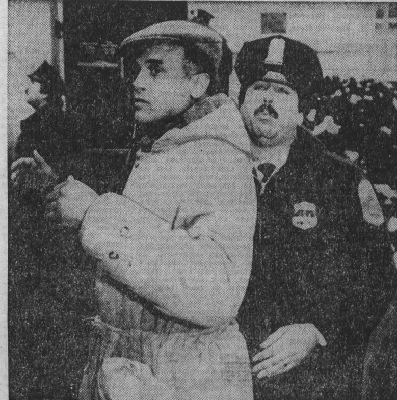
АМЕРИКАНСКАЯ полиция жестоко расправляется с теми, кто выступает против политики «конструктивного сотрудничества» с преступным режимом апартаида в ЮАР.

В связи с недавним полетом в космос американского космического корабля многоразового использования типа «Шаттл» с секретными целями австрийский журналист Рудольф Хофштеттер взял интервью у крупного ученого ФРГ Германа Оберта.