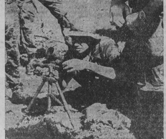
На территории США действуют многочисленные центры вербовки наемников для засылки в страны Центральной Америки, против которых вьетнамская администрация разворачивает вооруженную войну. Под крышами этих центров приносятся профессиональные кадры, прошедшие «школу» войны во Вьетнаме. Они вербуют и направляют опытных «инструкторов» в Сальвадор, обучают солдатно иррегулярного режима приемам борьбы с партизанами и обращению с оружием американского производства, засылают вооруженных бандитов в Гондурас, откуда совершаются военные авантюры против Никарагуа.

В этот же период разведывательные самолеты ВВС Таиланда несколько раз вторгались в воздушное пространство провинции Кохконг. Продолжались также нарушения морской границы республики таиландскими судами — в течение недели зафиксировано сотни таких нарушений в районе островов Кохконг и Кохтанг.