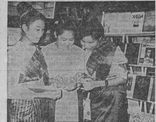
ЛНДР. На выставке советской книги во Вьентьяне.