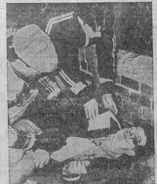
Эти действия США, говорится в меморандуме, вынесенном на заседание Национальной ассамблеи Филиппин...