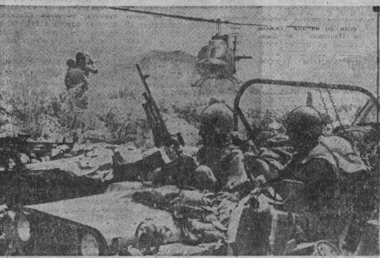
НА ЗАХВАЧЕННОЙ ливанской территории израильские оккупанты проводят кампанию террора против мирного населения...