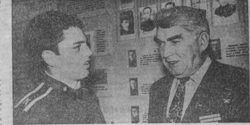
РАВНЕНИЕ НА ПОДВИГ

Рекорд закономерен. Это доказывают цифры. 31 января коллективы трех бригад сумели сэкономить 50 тысяч