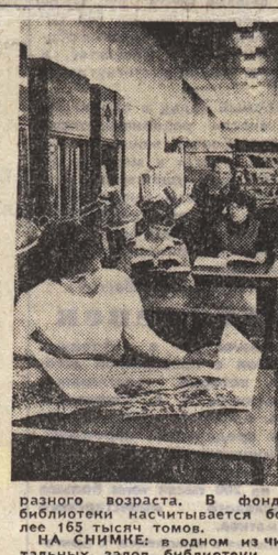
В фонде библиотек насчитывается более 165 тысяч томов.

На СНИМКЕ в одном из читальных залов библиотеки.