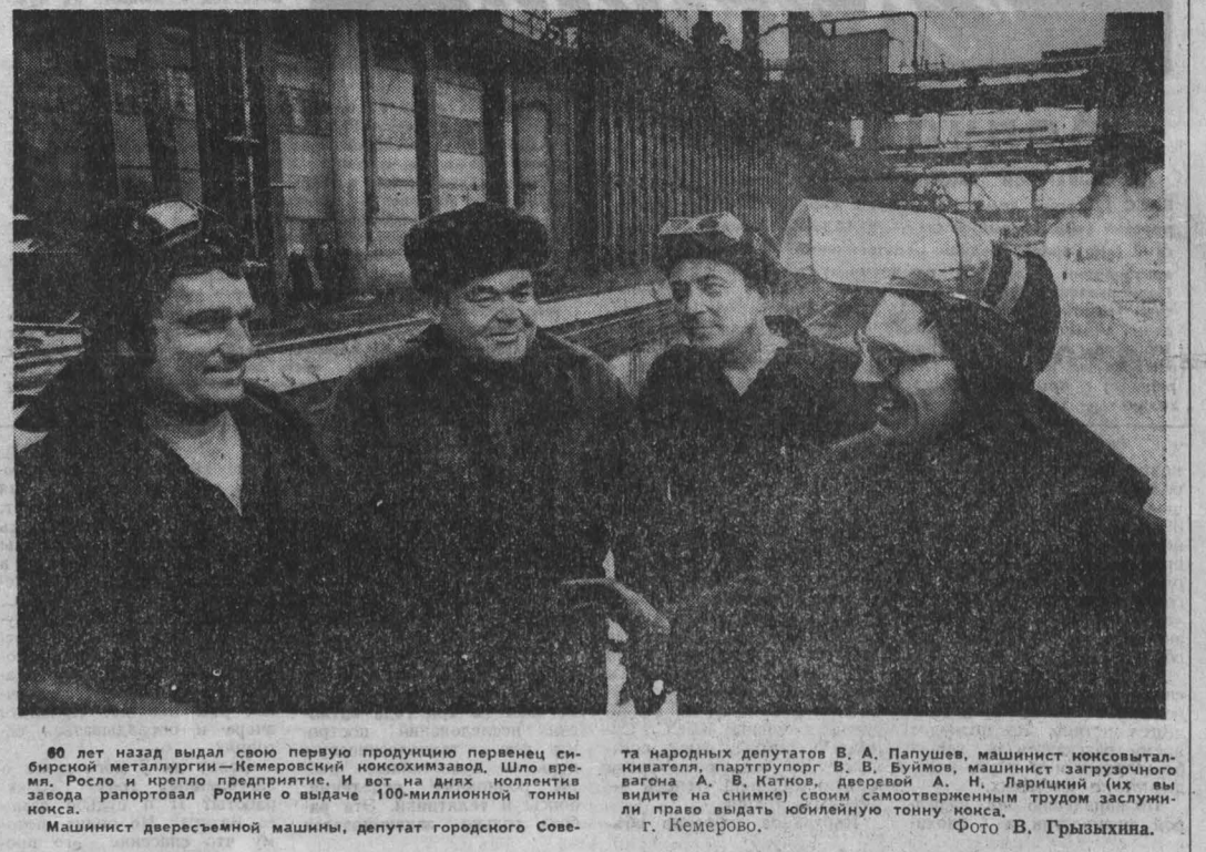
80 лет назад выдал свою первую продукцию перенес сибирской металлургии—Кемеровский коксохимзавод. Шло время, Росло и крепло предприятие. И вот на днях коллектив завода рапортовал Родине о выдале 100-миллионной тонны кокса.

Коллектив шахты «Капитальна» объединения «Южкузбасстуголь» завершил выполнение годовой программы. На гора отправлено три миллиона 190 тысяч тонн топлива.