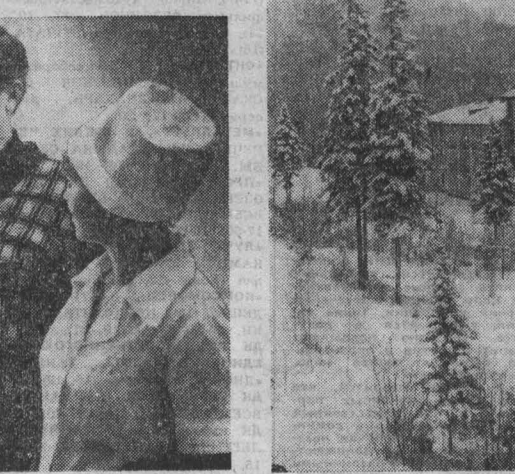
В мире интересного

З. СУВорова. г. Кемерово. В книгах о целебных растениях «живое дерево» называется каланхоэ. Вот что сказано о нем, например, в учебном пособии для студентов биологических специальностей вузов «Лекарственные растения» (изд. Москва, «Высшая школа», 1975 г.). В хирургической практике сок каланхоэ применяют для лечения долго не заживающих ран, трофических язв голени, при пролежнях и гнойных процессах с омертвевшей тканью. В стоматологии сок каланхоэ успешно используют при воспалении десен и полости рта, врачи болезней уха, горла и носа — для лечения и после операции хронических тонзиллитов и гнойном воспалении среднего уха. Призали сок каланхоэ и гинекологи. Естественно, самолечение этим растением недопустимо.