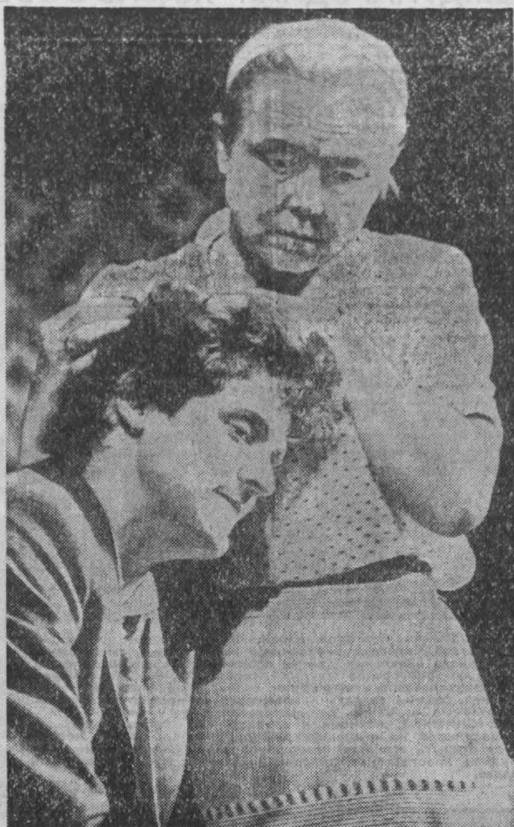
Ему неприятны отвлеченные разговоры о добре; он знает, что добрым быть трудно, а также, что добро всегда конкретно. Драматург осложнил положение героя невыгодным сравнением искренности признания Христолюбова к Соколику с материнским чувством Марии Васильевны. Актеру удалось передать авторскую размышления о том, что человеку не дано права, даже если он смертельно оскорблен или несправедливо обижён, из мести расквитаться с сыном.