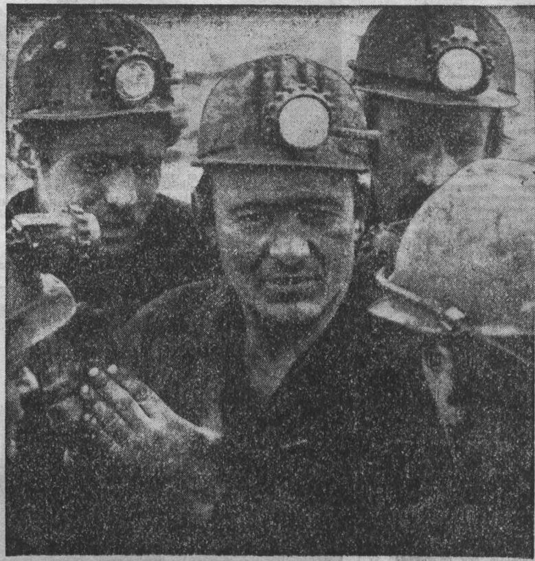
Делегат XX областной партконференции