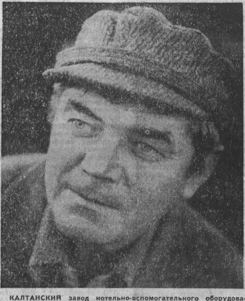
КАЛТАНСКИЙ завод котельно-вспомогательного оборудования и трубопроводов поставляет продукцию в зарубежные страны и во многие уголки нашей страны. Сегодня коллектив завода работает над важным и сложным заказом для Сургутской ГРЭС-2: нужно будет изготовить 286 тонн блоннов трубопроводов циркуляционных годоводов.

Все пять очистных бригад с начала года трудятся с опережением графика. Но наибольший вклад в общешахт.