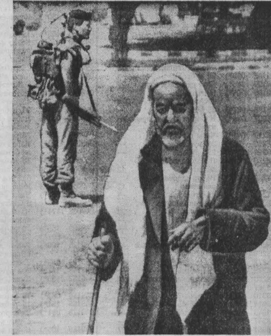
Тель-Авив, пытаются удержать захватнические силы арабские террористы, усиливая террор и репрессии против палестинского населения. Фигуранты устраивают погромы в домах арабов, проводят полюдные обыски и облавы.

Тэдди Коллек—мэр города Иерусалима—чувствовал себя иронично. Пышные речи, горячие рукопожатия, здравия под звон бокалов, торжественный «отход» древнего города «премию» израильской и западноевропейской прессе.