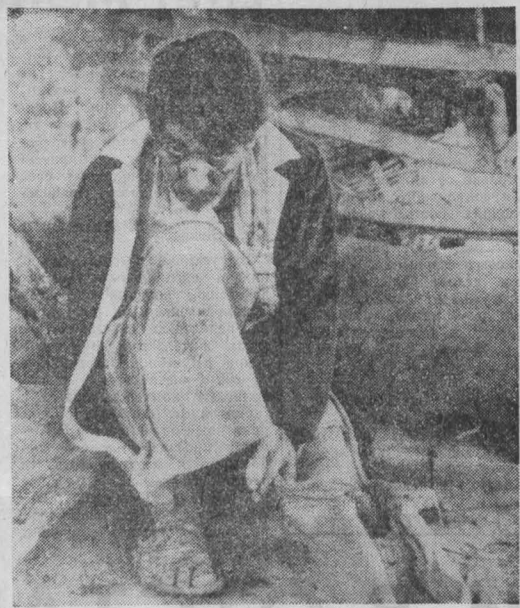
ПРОГНИВШИЙ сальвадорский режим Хосе Наполеона Дуарте держится у власти лишь благодаря постоянной вооруженно-экономической помощи США и ряда других стран. Как сообщает агентство Нуэва Никарагуа, в 1985 финансовом году американская администрация выделила ему 454 миллиона долларов. Режим получил также значительную финансовую помощь от ФРГ и Великобритании. Половина полученных средств была использована для подавления ширившегося в стране национально-освободительного движения и осуществления карательных операций против гражданского населения. Но, несмотря на столь щедрую помощь, сальвадорская армия не способна противостоять натиску патриотов. Партизаны свободно действуют практически на всей территории страны. Они пугают под откос военных назначения, уничтожают опорные базы и другие военные объекты войск противника.

Срывая злобу за поражения на полях боя, антинародный режим усиливает репрессии против мирного населения. Как сообщает радио «Фарабуно Мартин», в результате варварской бомбардировки в руины был превращен населенный пункт Эль-Онталь (департамент Чилатанго). Всего же в июле сальвадорская авиация нанесла бомбовые удары по 22 крестьянским селениям.