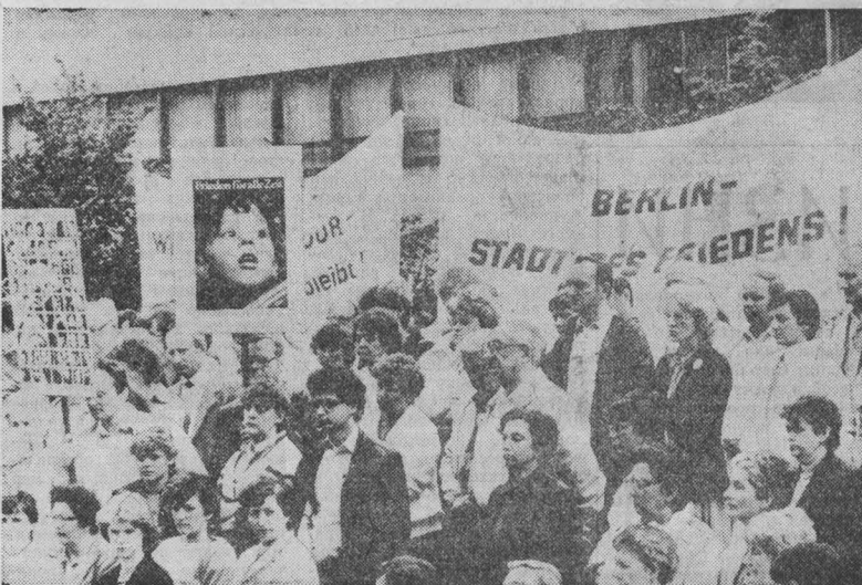
«БЕРЛИН — город мира», «Мир на все времена» — под этими лозунгами собралась на массовую антивоенную манифестацию тысяча жителей столицы ГДР. Они подтвердили свою решимость и впредь отдавать все силы ради сохранения всеобщего мира и прекращения гоним вооружений, во имя обеспечения безопасности народов и разрядки, для предотвращения ядерной катастрофы.

его руководителя. Он указал также, что правительство согласилось с созданием парламентской комиссии по расследованию обстоятельств потопления «Рейнбоу уорриор». Телепрограмма ТФ-1 отмечает, что выступление Л. Фабиуса преследует цель быстрее положить конец разрастанию в стране в связи с гибелью судна политическому скандалу.