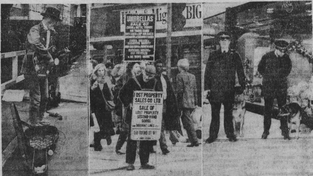
Около 18 миллионов жителей Великобритании живут сегодня за «чертой бедности». Многие из них не имеют ни крова, ни средств для пропитания. Потеря рабочее место, обездоленные англичане вынуждены как-то зарабатывать себе на кусок хлеба, ибо нищенство в стране запрещено. НА СНИМКЕ: уже молодой житель Лондона зарабатывает на пропитание игрой на гитаре. Этому пошлому горожанину «посчастливилось» стать