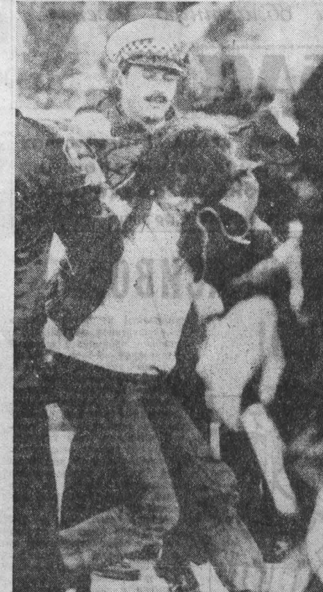
«Нет» — апартеиду в ЮАР!