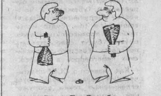
Рис. Б. Эренбурга.