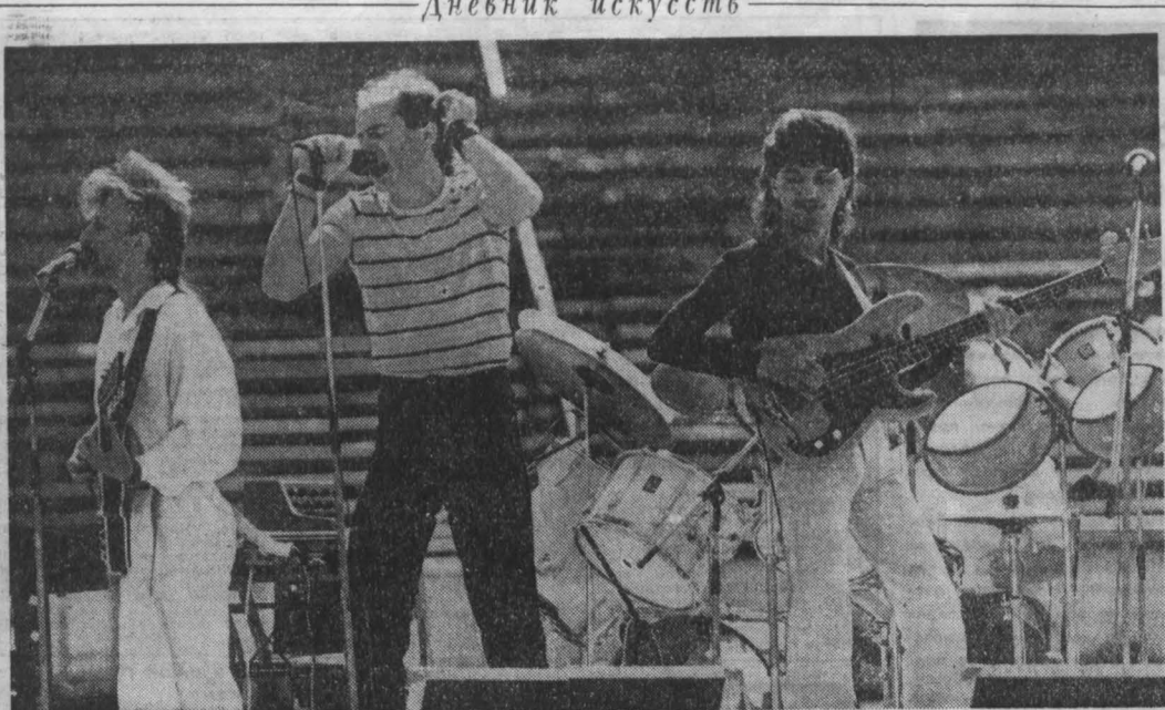
Группа «Круз» впервые гастролирует в Кузбассе. На композиции, созданные участниками этого ансамбля, хорошо известны любителям популярной музыки...