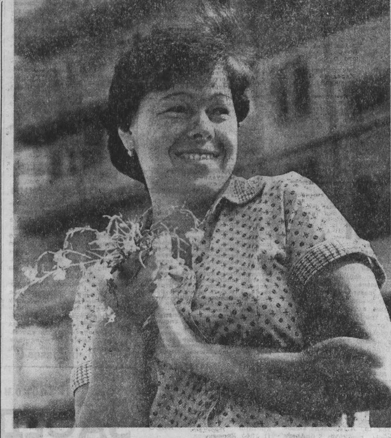
Более четырнадцать лет работает в Кемеровском специализированном управлении механизации главкузбасской краевоща Гали на Обельчухова. За это время с ее помощью