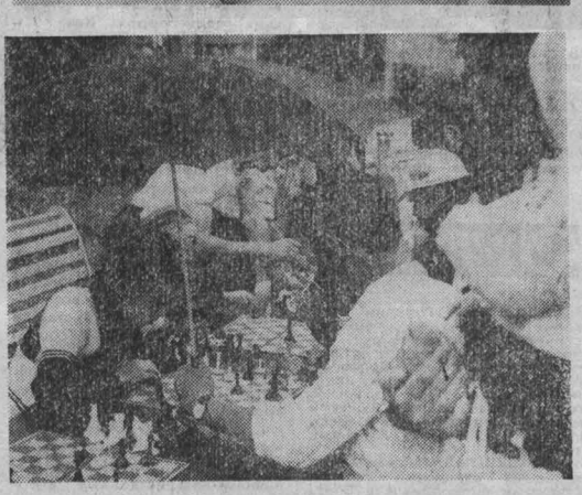
НА СНИМКАХ: ярмарка работает. Фото Д. Коробейникова, г. Кемерово.