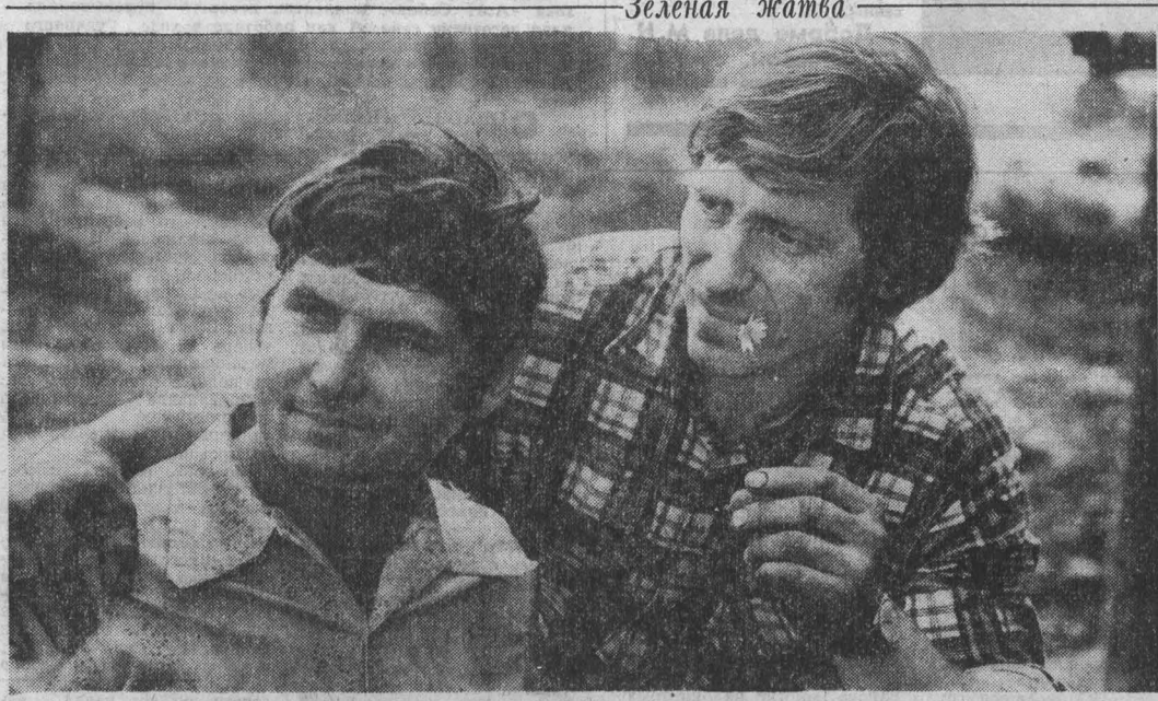
В ПРОШЛОМ ГОДУ в совхозе «Юрьевский» готовили отличную травяную муку — 86 процентов ее было первого класса, Механизаторы, которые работали на агрегате витаминной муки,

На разрезе «Черниговский» начала действовать технологическая линия по вывозке горной массы в отвал с помощью мощных 110-тонных БелАЗов. Чем глубже уходят от дневной поверхности забой, — рассказывает исполняющий обязанности главного инженера разреза И. Ю. Прокудин, — тем все больше возрастает объем вскрышных работ. Так, чтобы ничем выполнить план по добыче угля, мы должны переработать в отвал 11 миллионов 300 тысяч кубометров горной массы. А на будущий год этот объем увеличится уже до 15 миллионов. Чтобы справиться с этой сложной задачей, у коллектива водителей Черниговской автобазы есть два пути: увеличить парк традиционных сорокитонных БелАЗов или применить сверхтяжеловозы. Второй путь оказался хотя и дороже, но надежнее. Если в среднем один сверхтяжеловоз по объединению «Кемеровоуголь» дает годовую выработку 900 тысяч кубометров горной массы, то традиционный «сорокитонник» на разрезе — лишь 300 тысяч кубометров. Выходит, перевес за руль сверхтяжеловоза, водитель повышает свою производительность труда в три раза. г. Березовский.