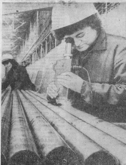
ЧЕХОСЛОВАКИЯ. Трубопрокатный завод в Хомутове — крупнейший торговый партнер Советского Союза. Главную экспортную статью предприятия составляет бесшовные трубы большого диаметра. Их ждут газопромысловые Удмуртии, Татарии, нефтяники Сибири и Азербайджана, украинские гидроэнергетики. «Стальные артерии» чехословацких труб отличаются высокой надежностью. НА СНИМКЕ: в новой чехо чехомостью 12 тысяч тонн антикоррозийных труб в год. Идет проверка готовой продукции.

Д. СОТИРИУ, греческая писательница (АПН). Афины.