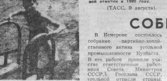
в лагере саней и фехтования, и футбольная, и велоспортивная. Опытные тренеры ведут занятия с ребятами.