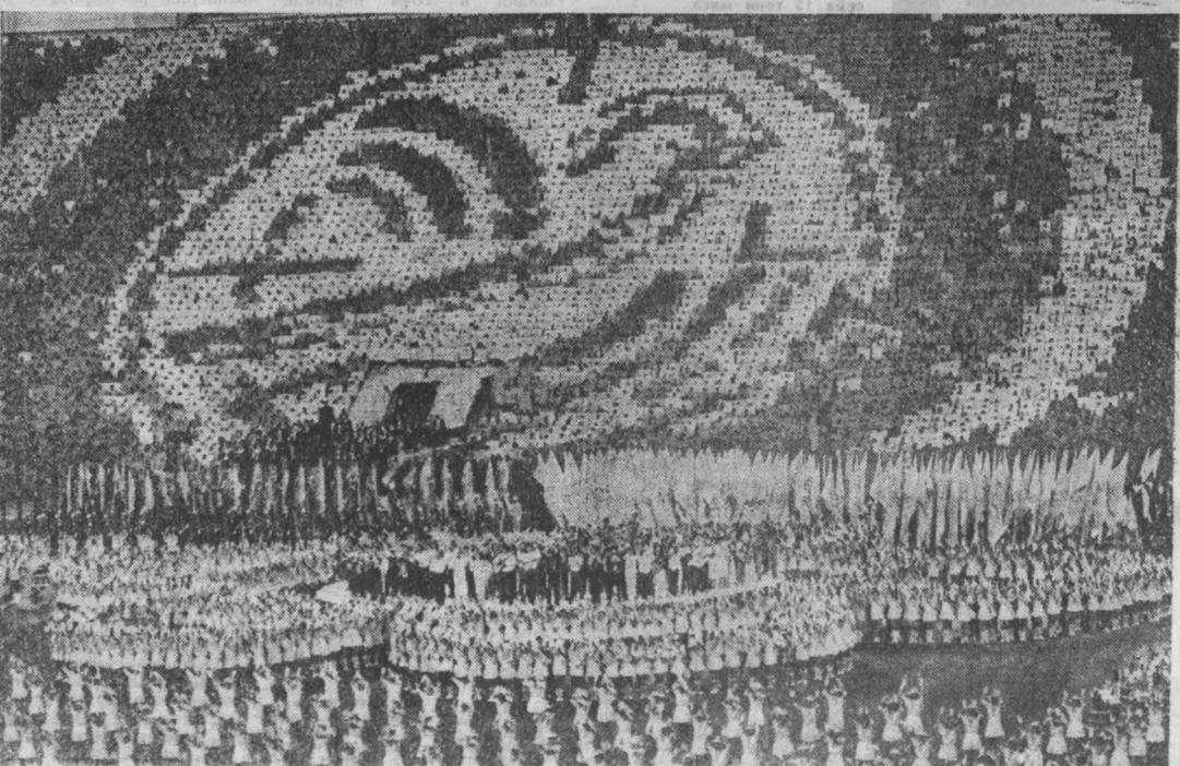
Во время торжественного закрытия XII Всемирного фестиваля.