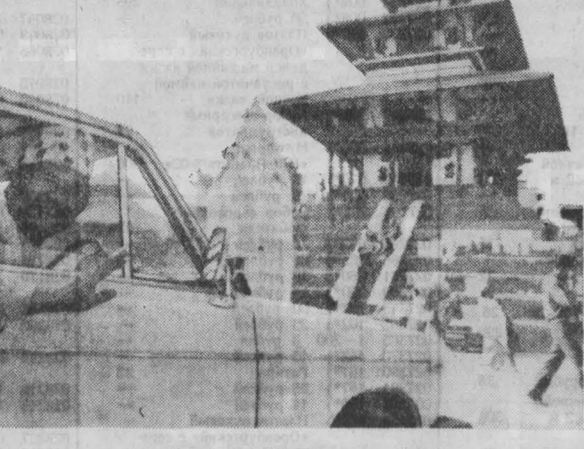
Несколько десятилетий назад автомобиль в Непале означал всеобщее удивление. Сегодня он уже не редкость на дорогах этого небольшого горного государства. Популярность в стране, благодаря своим техническим характеристикам и высокой надежности, снискали советские автомобили. НА СНИМКЕ: владелец «Лады» из Катманду очень доволен своей автомашиной.

ВАШИНГТОН , 26. (ТАСС). Здесь открылась трехдневная конференция руководителей правых политических партий, входящих в так называемый «Международный демократический союз» (МДС). В ней принимают участие члены руководства различных консервативных партий из ряда стран Европы, Азии и Америки, включая вице-президента США Дж. Буша, премьер-министра Великобритании М. Тэтчер, председателя западногерманского христианско-социального с