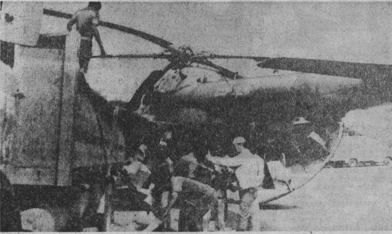
Верный своему международному долгу, СССР немедленно откликнулся на просьбу японского руководства о содействии в ликвидации последствий жестокой засухи, охватившей 12 из 14 провинций страны.

ВАШИНГТОН, 18. (ТАСС). В интервью информационному агентству председатель сенатского финансового комитета Р. Пайкуд подчеркнул, что верхняя палата высшего законодательного органа США намерена сократить ассигнования в размере более 313 млрд. долларов, которые Пентагон запросил в рамках проекта федерального бюджета на 1986 финансовый год.