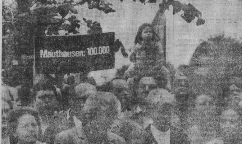
ФРГ. «Не забывать уроков прошлого!». «Мы говорим «нет» фашизму и войне!», «Память о миллионах жертв обязывает делаться всеми во имя мира на земле» — под танами лозунгами во многих городах Западной Германии проходит массовые манифестации.