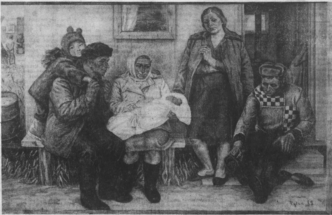
Сегодня на выставке начинаются Дни Новосибирской организации Союза художников РСФСР