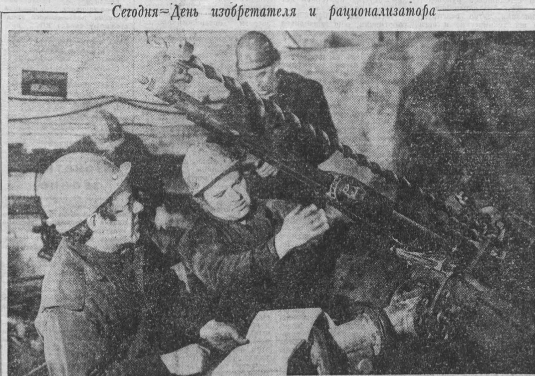
Сегодня — День изобретателя и рационализатора

«Хвосты» доставляют углеобогащению очень много хлопот. На каждой фабрике их ежегодно бывает многие сотни тысяч тонн и все надо отвозить на свалку. Это невыгодно — требуется много транспорта, под отвалы уходит значительные территории полей и пашни. Да и вредно — своими выделениями «хвосты» отравляют атмосферу. На ЦОФ «Абашевская» — тогда она входила в систему объединения «Юнкусбассустрой» — пытались утилизировать отходы. Например, отсыпали грунтовыми дорогами. Однако попытка оказалась неудачной. Резко возросла потребность в автотранспорте — в две смены работали до пятнадцати большегрузных самосвалов. Кроме того, необработанные хвосты, разлагаясь, пре-