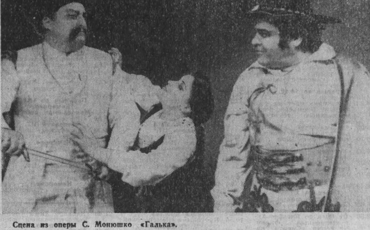
Сцена из оперы С. Монюшко «Галька».