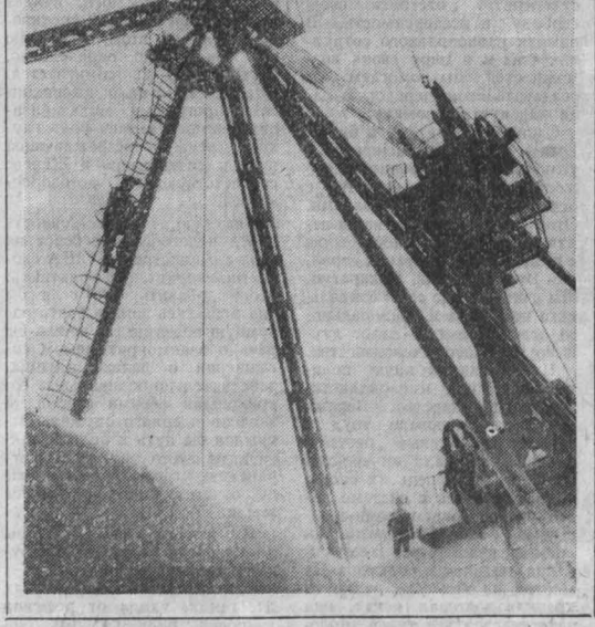
Идет монтаж экскаватора.