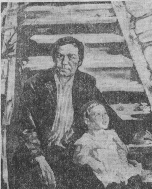
Значительная часть которых является воспитанниками Иркутского училища искусства.

— Сейчас в составе секции по работе с молодыми художниками более 30 человек.