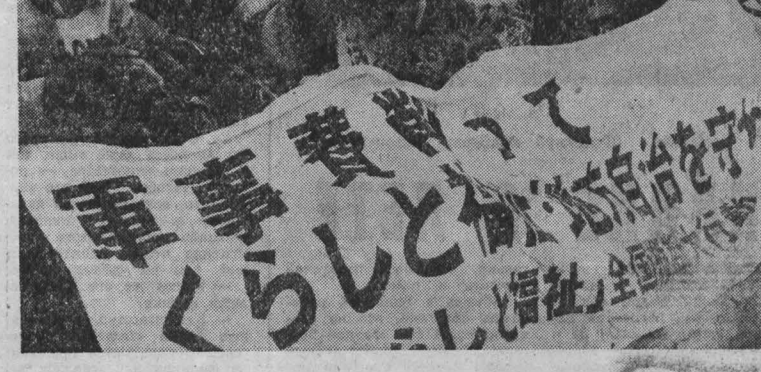
ТЫСЯЧИ стариков в Японии практически брошены на произвол судьбы. В условиях роста стоимости жизни им все труднее сводить концы с концами. Полученные после увольнения единоразовные пособия быстро иссякают, а мизерных пенсий не хватает даже на питание. Тяжелый удар нанесло правительство консерваторов по миллионам стариков, отменив существовавшие для них льготы на медицинское обслуживание. Как показывают