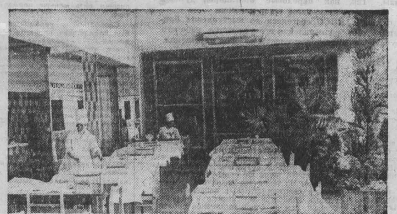
Большой популярностью у рабочих объединения «Органический машиностроительный завод» пользуется санаторий-профилакторий «Бодость». В 1984 году коллективу профилатория было присвоено звание коллектива коммунистического труда. Медицинский и обслуживающий персонал старается сделать все, чтобы в санатории были созданы хорошие условия для отдыха. Здесь применяют грязе-