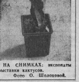
НА СНИМКАХ: экспонат выставки кактусов.