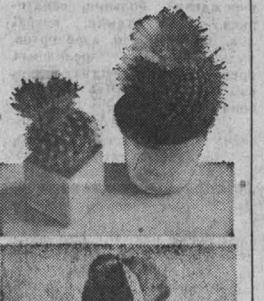
НА СНИМКАХ: экспонат выставки кактусов.

Е. МУРЫШКИНА, председатель клуба любителей кактусов, г. Кемерово.