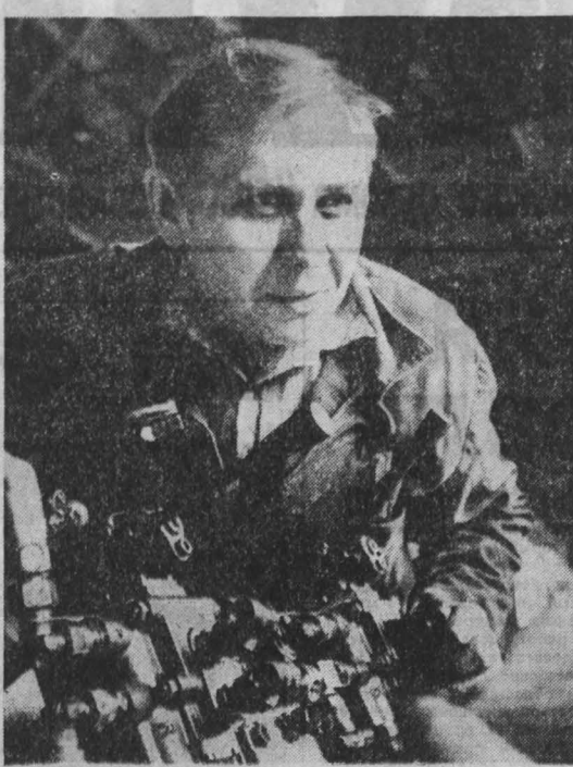
КОРМЗ — так сокращенно называется Кемеровский опытный ремонтно-механический завод. Его коллектив выпускает для различных строений бетононасосы БН-80-20М1, дизель и гидромолоты...