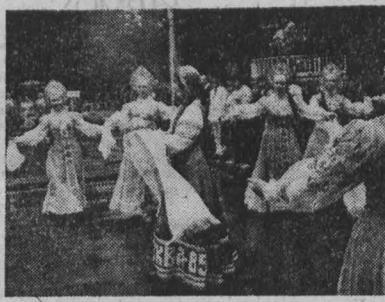
г. Новокузнецк.

П. БУГАЕВ. НА СНИМКАХ: на митинге открытия; фестивалю — хлеб-соль; идет конкурс политической песни; детский праздник в парке им. Ю. А. Гагарина.