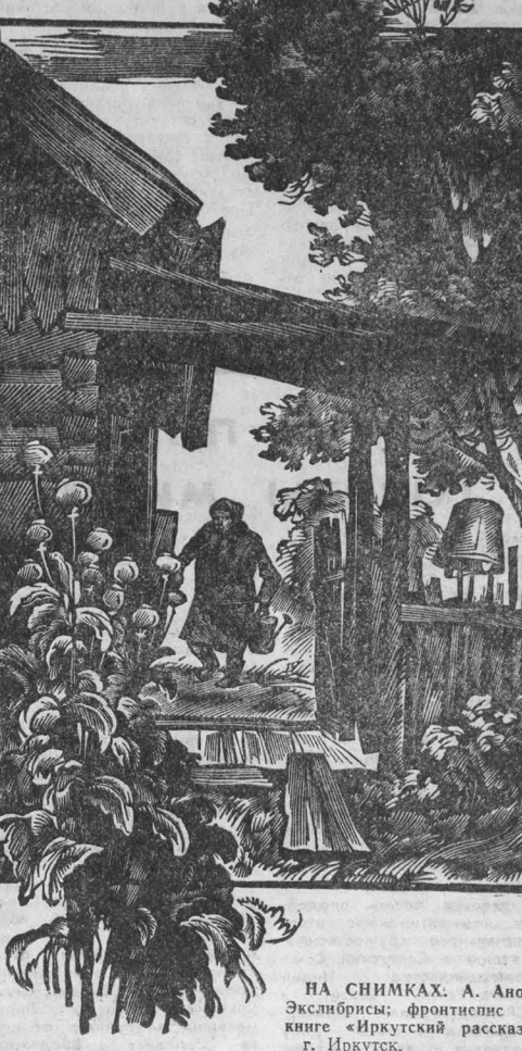
НА СНИМКАХ: А. Аносов. Экслибрис; фронтиспис к книге «Иркутский рассказ». г. Иркутск.