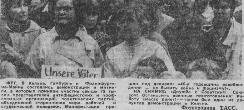
ФРГ. В Кельне, Гамбурге и Франкфурте-на-Майне состоялась демонстрация и митинг, в которых приняли участие свыше 75 тысяч представителей антифашистских и профсоюзных организаций, политических партий, объединений сторонников мира, рабочих и студенческой молодежи. МанIFESTация прошла под девизом: «40-я годовщина освобождения не вывет война и фашизм».

ДЕЛИ. Индия выразила протест Пакистану в связи с нарушением самолетами пакистанских ВВС воздушного пространства республики. По сообщению газет «Хиндустан таймс», группа пакистанских истребителей вторглась в воздушное пространство Индии в районе ледных Слэки и долины Нубра в северной части штата Джамму и Кашмир.