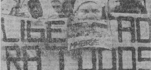
В САЛЬВАДОРЕ ширится выступления против антинародной политики проамериканского режима Дуарте. В столице страны г. Сан-Сальвадора состоялся массовый митинг, организованный комитетом родственников погибших и пропавших без вести. Его участники потребовали положить конец кровавым репрессиям против мирного населения страны и вынести судьбу сальвадорцев, объявленных «исчезнувшими».