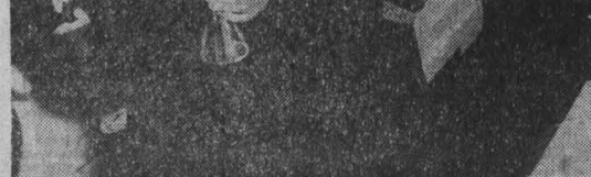
Г. СЕРГЕЕВ.

кухонные столы, подвесные шкафы для посуды, тумбочки под телевизоры, которых бывает недостаточно в мебели-