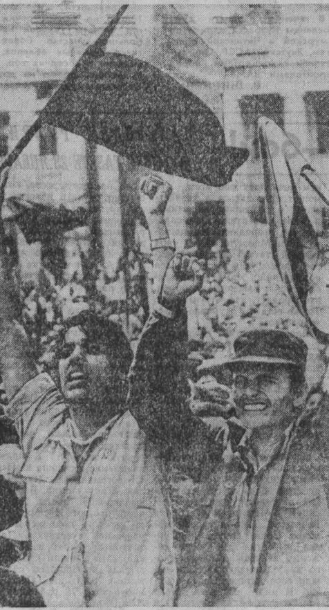
НАРОД Никарагуа, тесно сплоченный вокруг авангарда — Сандинистского фронта национального освобождения (СФНО), готов в любой момент выступить в защиту революционных завоеваний от посягательства контрреволюции и империализма на США.

С позывом осудить преступную агрессию, развязанную администрацией Рейгана против Никарагуа, обратился ко всем трудящимся мира Национальный координационный центр профсоюзов республик. Для обсуждения агрессивных притязаний американского империализма, подчеркивается в заявлении, необходимо крепить боевую солидарность всех международного рабочего движения.