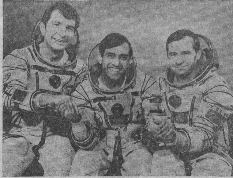
На снимке: космонавты Ю. В. Малышев, Ракеш Шарма и Г. М. Стрекалов.