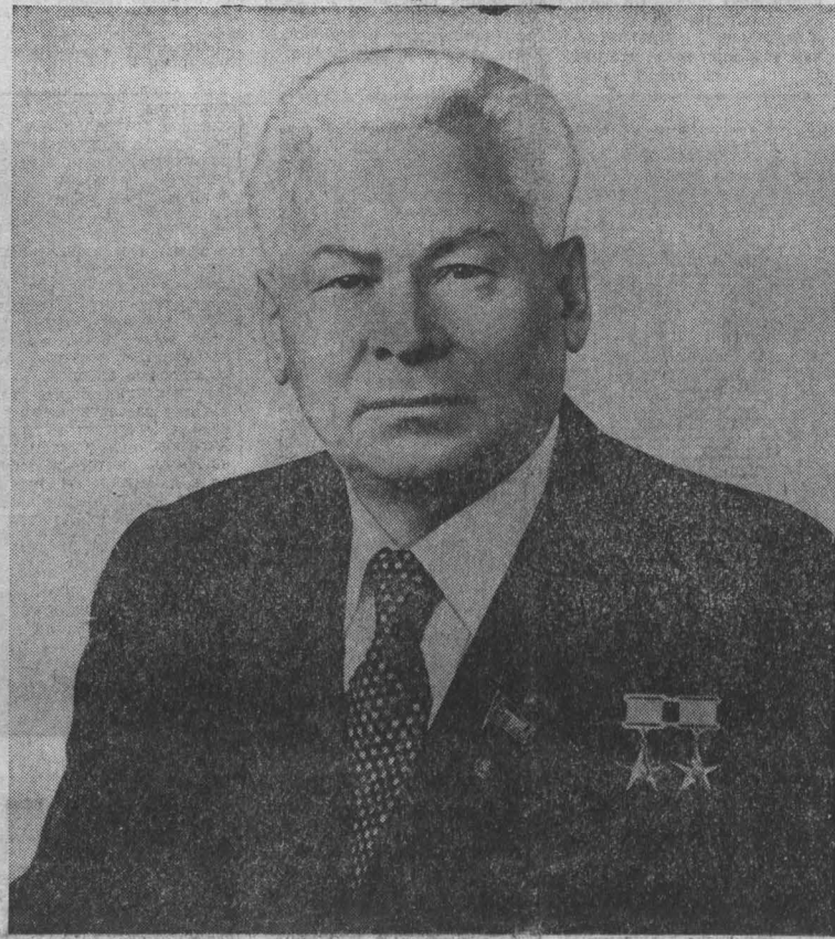
К. У. ЧЕРНЕНКО, Генеральный секретарь ЦК КПСС, Председатель Президиума Верховного Совета СССР