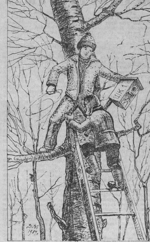
Друзья природы. Рис. Д. Михалеенко.