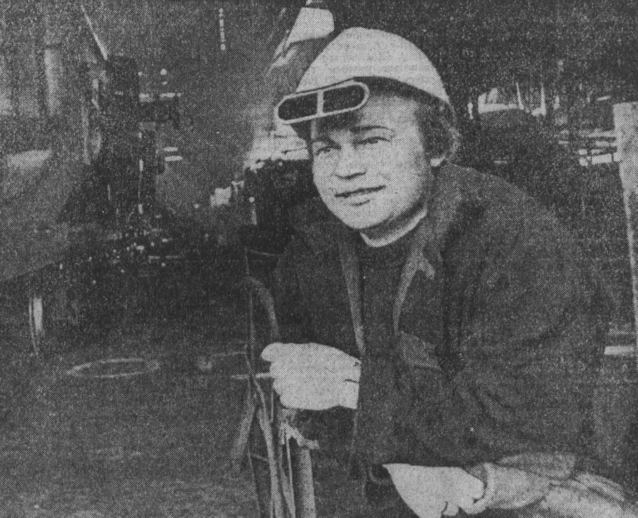
Ручной труд — машинам

В апреле междуреченцы обязались выдать дополнительно 25 тысяч тонн угля — более одного процента к плану. П. ШАБРИХИН, корр. «Кузбасса».