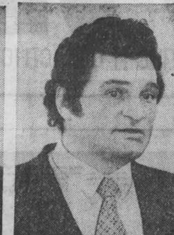
В. С. ЗАЙЦЕВ: Помимо прохода, мы занимаемся посторонними работами и... провалили обязательства.