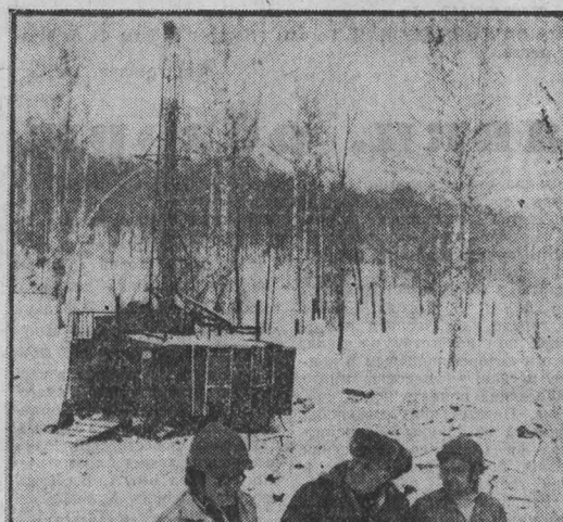
Василий Сергеевич поддал жару: «Не сможем начать зимой — считай на год сорвем работу».