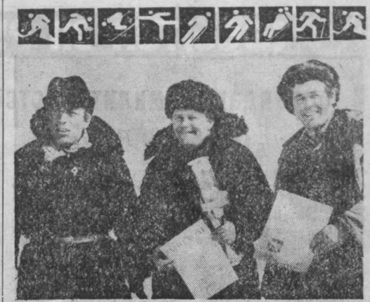
Рыболовный спорт Приз за удачу